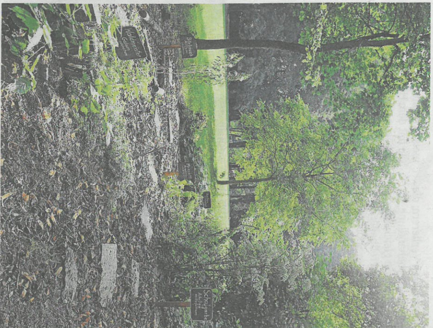
Ronsdorfer Anlagen, Zentrum für gute Taten, Bandwirkerbad.

außen gezeigt werden, dafür sei die Woche ein guter Rahmen. Auf der Internetseite